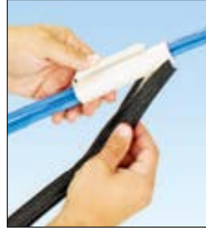
팬랩 망사 튜브를 공구의 끝부분부터 삽입한다.