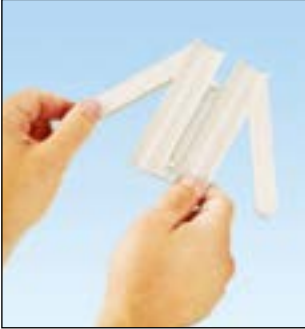
팬랩 작업 공구를 열어 케이블 번들을 삽입한다.