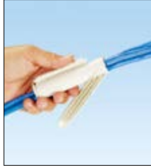
팬랩 작업 공구를 닫는다.