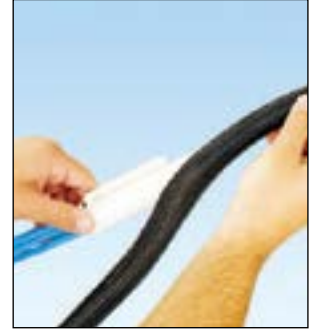
팬랩 망사 튜브의 끝을 잡고 공구를 필요한 길이만큼 잡아 당긴다.